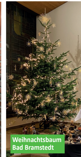
Weihnachtsbaum Bad Bramstedt