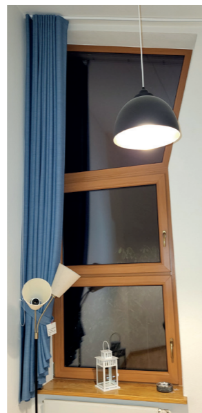
Gardinen im Blauen Salon Bad Bramstedt