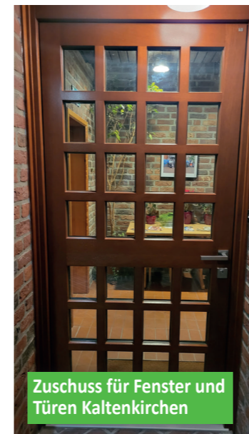
Zuschuss für Fenster und Türen Kaltenkirchen