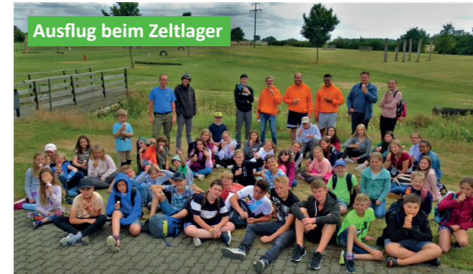
Ausflug beim Zeltlager