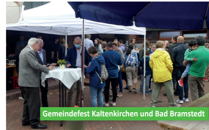
Gemeindefest Kaltenkirchen und Bad Bramstedt